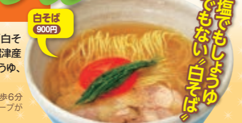
白そば 900円 ☎麺は特注の中細ストレート。鶏モモチャーシューやトマトなどがのる