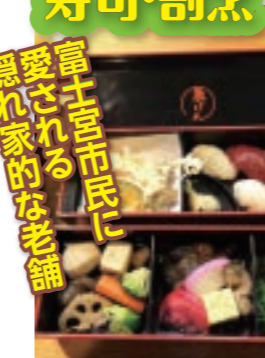
☎老舗の味を堪能できる寿司懐石弁当は3850円