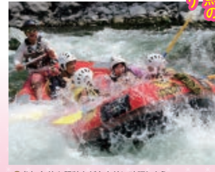
◎参加条件や服装などを事前に確認しよう

日本有数の急流として知られる富士川をゴムボートで下るラフティングを体験できる。家族やグループで楽しもう。