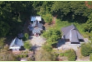
◎木花開耶姫をはじめ七柱をお祀りしている

富士山における修験道の中心地であった場所で、明治時代の廃仏毀釈運動以前は興法寺という寺院が建っていた。現在も境内には、修験者などが身を清めた水垢離場や護摩壇の跡が残されている。◎富士宮市村山1151◎JR富士宮駅から車で20分◎参拝自由◎37台