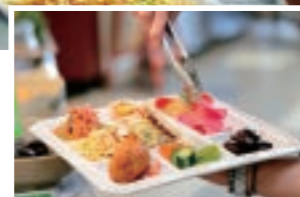
☎契約農家から直接仕入れた野菜を使った料理が特に人気

☎富士宮市根原449-10 ☎JR富士宮駅から車で40分 ☎11時～14時30分受付終了 ☎不定休 ☎70台(あざざりフードパーク駐車場)