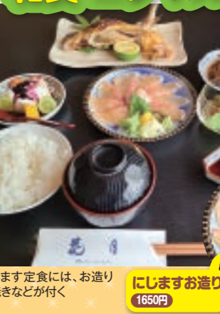
☎にじます定食には、お造りや塩焼きなどが付く