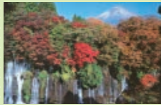
◎滝と富士山が一度に見られる展望台がある

富士山の雪解け水が絶壁から湧き出し、高さ20m、幅150mにわたって大小数百の滝となって流れ落ちている。滝壺の近くまで接近すると、三方が水のアーチとなっている幻想的な光景が広がる。◎富士宮市上井出◎JR富士宮駅から車で25分◎見学自由◎110台(有料)