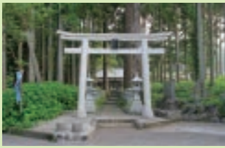
◎燈籠が並び立つ参道の先に遙拝所がある

富士山の遙拝所があり、富士山祭祀の古い形を残しているといわれる神社。富士山本宮浅間大社(▶P8)は、この地から現在の場所に移転したという記録もあり、歴史の古さを物語っている。◎富士宮市山宮740◎JR富士宮駅から車で18分◎参拝自由◎15台