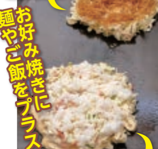
あられ焼き (肉・並) 748円