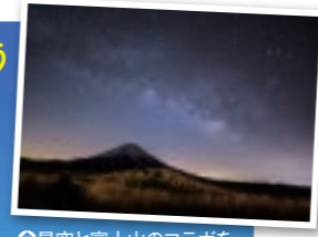
●星空と富士山のコラボを狙うカメラマンも多い

朝霧高原は、富士山だけでなく美しい星空にも注目したい。道の駅朝霧高原や、田貫湖をはじめ、富士山と星空が一度に見られる場所が多い。朝霧高原に泊まるときは、満天の夜空もチェックして。