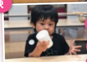
◎まかいの牧場で開催される、バターづくり体験

酪農が盛んな朝霧高原にある牧場では、動物たちへのエサやりや乳搾り、バター作りに農作物の収穫など、さまざまな体験メニューがある。通年実施のものや季節限定のものがあるので、事前にHPで確認しよう。