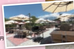
◎富士ミルクランドではBBQも人気