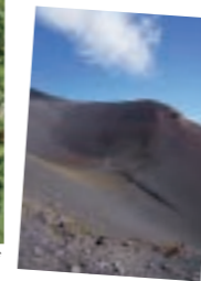
◎富士宮口六合目から宝永火口へ