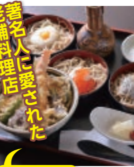
味くらべ 1980円 ☎4種類のそばと、井ものが一度に味わえる贅沢なメニュー

☎富士宮市西町5-5 ☎JR西富士宮駅から徒歩5分 ☎11～15時(14時30分LO)、17～21時(20時30分LO) ☎水曜☎30台