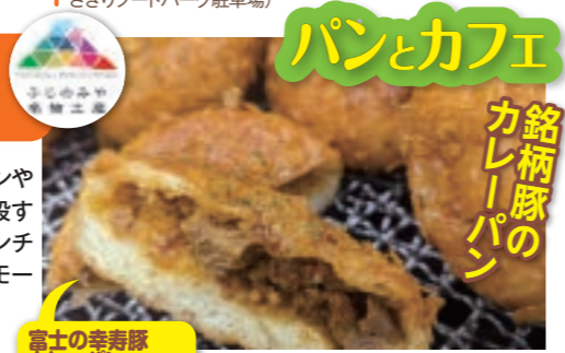
富士の幸寿豚カレーパン 319円(テイクアウト313円)

☎富士宮市城北町361 ☎JR富士宮駅から車で7分 ☎9時30分～17時30分(土・日曜、祝日は9時～) ☎木曜☎20台