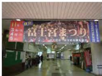
富士宮駅と西富士宮駅に吊り看板を設置しました

詳しくは富士宮まつり公式ホームページ http://akimiya.com まで