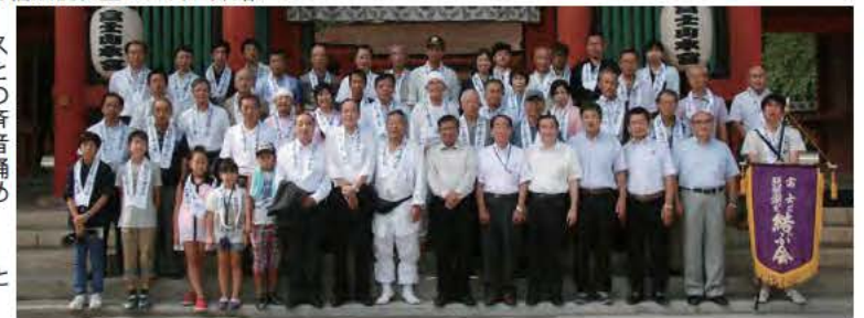
参拝後の近江八幡市訪問団と出迎いの須藤市長など