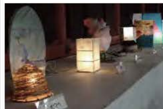
ふじの山かみ灯りコンテスト