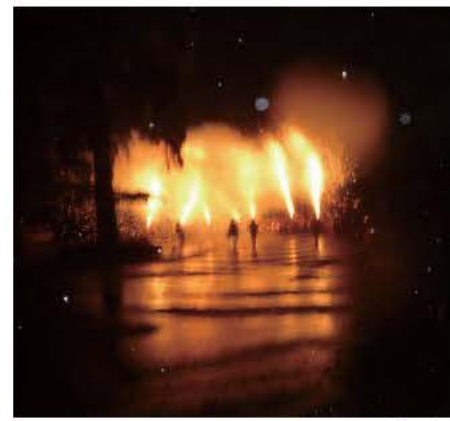
富士開山奉納手筒花火