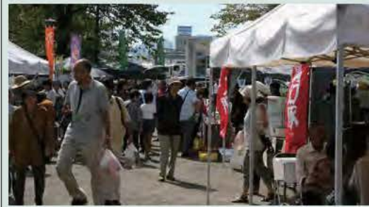
昨年の祭りの風景

街中の賑わいづくりと名物品発掘を目的に観光協会が定期的に開いているふじのみや門前市と富士宮の特産品を取り扱う(協)富士宮特産品振興会とが共同で、今年で第3回を迎える「ふじのみや門前市&特産品フェア」を9月28日(日)に浅間大社境内の神田川ふれあい広場にて開催します。