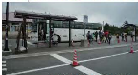
水ヶ塚駐車場(シャトルバス発着所)

18日には、登山道も山頂まで開通し、本格的な夏山登山シーズンを迎え登山者も増えてきました。富士山は日本一高い山、無理のない登山計画で登って頂きたいと思っております。