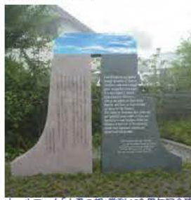
オールコック大君の都」発刊150周年記念碑

夜8時から、駿州白糸原手筒花火保存会の皆様による「富士開山奉納手筒花火」を神田川ふれあい広場にて雨中の中行いました。