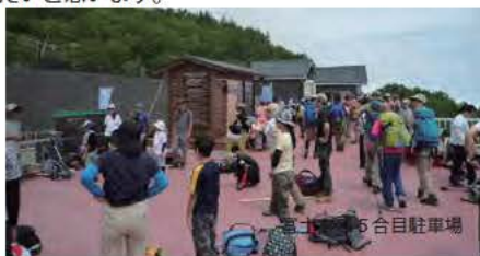
富士山5合目駐車場

また、富士登山や、五合目観光に訪れてくれた人達に、富士山に来て良かった、また富士山や富士宮に訪れてみたいと思って頂ける様に、ナビゲーターの人達がおもてなしの気持ちを持って対応しています。