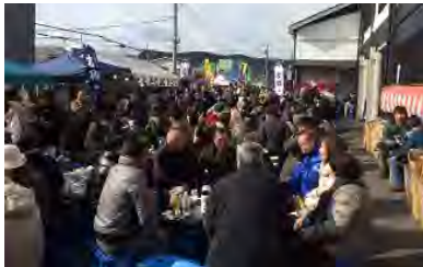
富士高砂酒造蔵開きのようす

蔵開きは、市長・両副市長・近隣3区長の挨拶後、市長の乾杯の音頭とともに始まり、15店舗ほど並んだ出店やステージイベント等もあり、会場は1日中大賑わいでした。