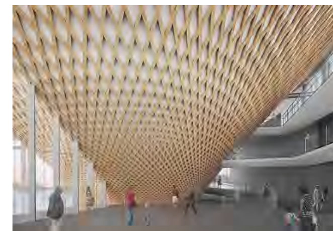
富士山世界遺産センター1階ロビーイメージ図

今年の干支は酉年。 酉年は「取り込む」ということで商売繁盛につながるとも言われています。 会員の皆様におかれましては、観光事業に御協力いただきたくお願い申し上げますとともに、本年が皆様にとって良い年となりますようお祈りいたします。