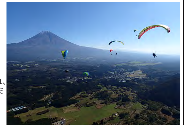
あさぎりフォトコンテスト大賞作品 作品名「秋の空中散歩」