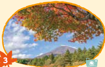
3 にしうずがちゆうしゃじょう 西白塚駐車場