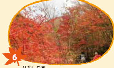
6 けなしやま 毛無山 10月25日から11月5日頃 (ウルシ、カエデ)