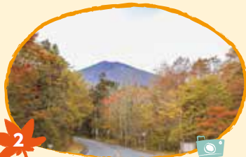
2 ふじさん 富士山スカイライン 10月20日から25日頃 (カラマツ、ウルシ、カエデ)