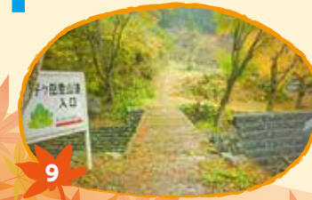
9 てんしがたけ 天子ヶ岳 11月5日から15日頃 (ウルシ、カエデ)