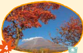
4 ふじぐら しぜんぼちこうえん 富士桜自然墓地公園