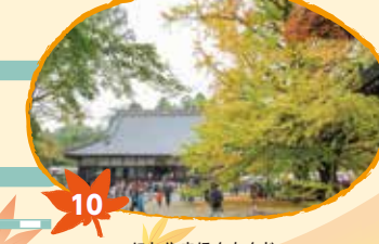
にしやまほんもんじ 西山本門寺