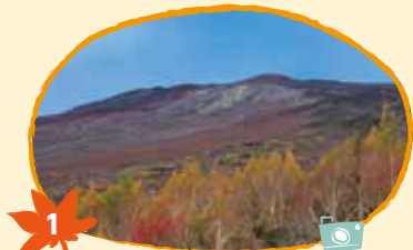
1 ふじさんふじのみやぐちごごめ 富士山富士宮口五合目 10月4日から20日頃 (イタドリ、ナナカマド、カラ松)

日本一の標高差のある富士宮市は、海拔の高い山腹の富士山地区や、北部地区からだんだんと紅葉が見頃を迎えます。富士山五合目は10月上旬から色づき始め、市内の各場所で12月上旬までの約2ヶ月間、紅葉の景色を楽しむことができます。特に 白糸ノ滝 は、滝を覆うように茂っているウルシやカエデが紅く美しく色づき、白く輝きながら流れる滝と相まって、この時期にしか見られない絶景を作り出します。