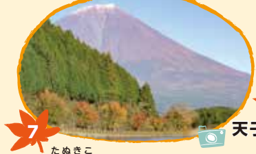
7 たぬきこ 田貫湖 11月10日から20日頃 (カエデ他)