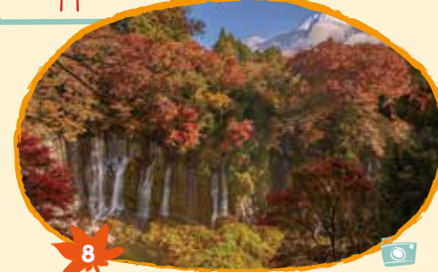
8 しらいと 白糸ノ滝 11月10日から20日頃 (ウルシ、カエデ)