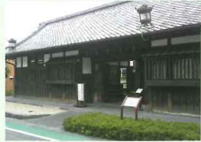
長屋門 (富士宮駅から歩いて10分)