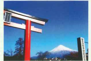
大社と富士山 (富士宮駅から歩いて10分)

富士宮市役所 観光課 E-mail: kanko@city.fujinomiya.lg.jp TEL 0544-22-1155