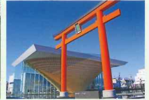
富士山世界遺産センター (富士宮駅から歩いて8分)