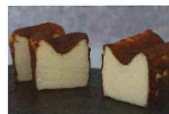
生んで宮！ 育てて宮！部門 大賞