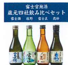
推して宮！部門 大賞